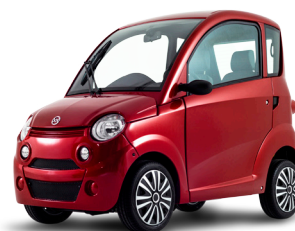
BROMMOBIEL (AM rijbewijs)